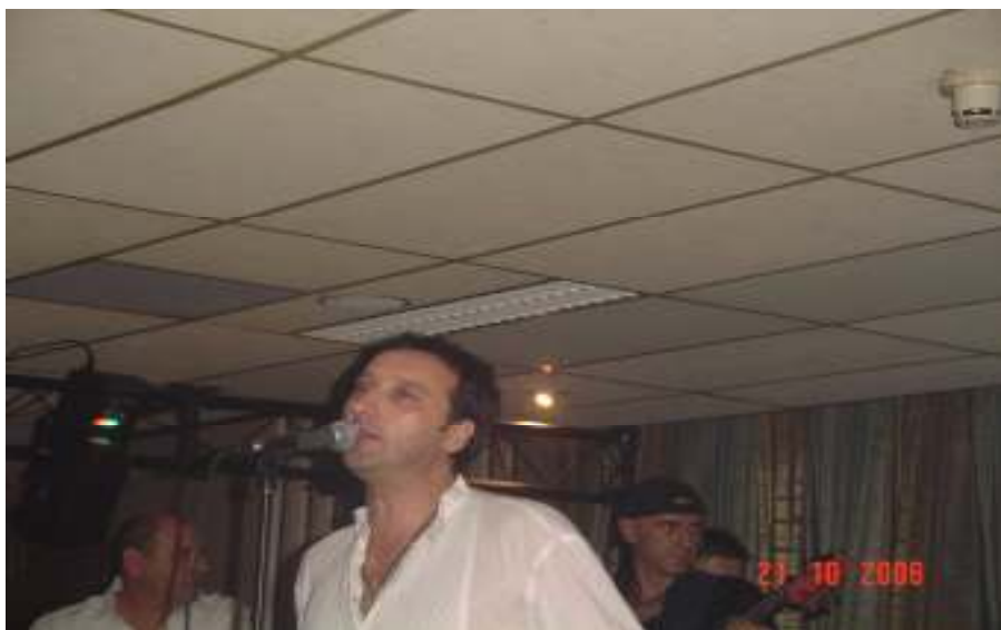
Hari Varesanovic je odusevio brojnu publiku na koncertu u Tilburgu

Medjutim, posebnost je u tome sto je gost bio bas Hari Varesanovic, covjek koji je na posljednjem Eurosong festivalu u Atini osvojio sjajno 3. mjesto sa izvanrednom kompozicijom "Lejla". Ovo je bio njegov prvi nastup nakon tog znacajnog uspjeha kako za njega tako i za nasu domovinu.