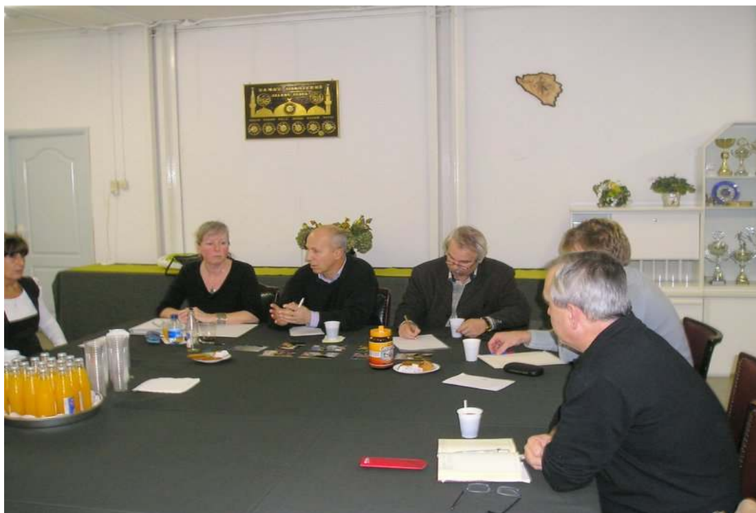
Dogovor o saradnji za narednu godinu predstavnika PC "Stari Most" i udruzenja BiH

Cilj je bio analiza protekle manifestacije 11. godisnjice sjećanja na genocid Srebrenice održane 11. jula 2006. pred Parlamentom u Den Hagu i nacelan dogovor za pripremu manifestacije sjećanja u julu 2007. godine.