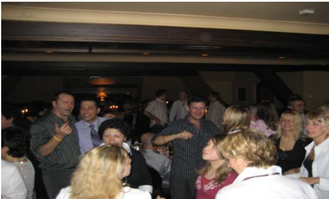
Raspolozeni Samcani prilikom posljednjeg jesenjeg susreta u Apeldornu 2006

Sve je pocelo nekako spontano, onako bas kako se i vecina lijepih stvari u nasem zivotu i dogodi. Bez puno razmisljanja i sastancenja grupa nasih sugradjana je dosla na ideju da se barem jedanput godisnje organizuje okupljanje gradjana Bosanskog Samca u nekoj od evropskih zemalja gdje i vecina nas boravi.