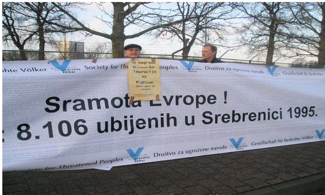
Društvo za ugrožene narode sa ženama Srebrenice i članovi bh. udruženja u Holandiji demonstriraju ispred kasarne u Asenu protiv paradoksalnih priznanja

Priznanje je bilo namjenjeno svim vojnicima no mnogi se nisu odazvali. Od 850 pozvanih bilo je oko 500 prisutnih.