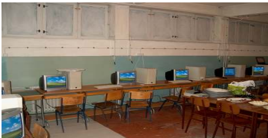
Ucionica opremljena savremenim kompjuterima za djecu Guce Gore