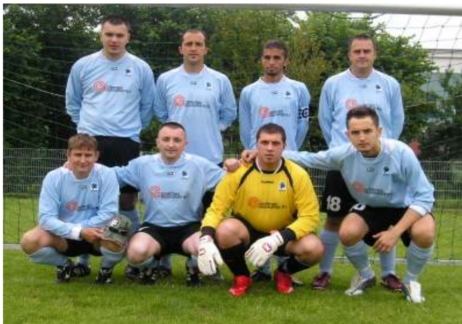
Ekipa ESA-BOSNA Arnhem, treće mjesto

Treće mjesto turnira pripalo je ekipi ESA-BOSNA Arnhem.