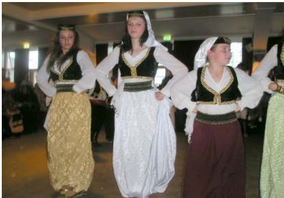
Folklorni ansambl IKC Bosnjak iz Arnhema u centru Engels