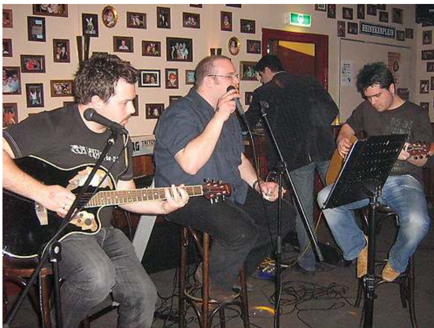
Orkestar Blim band acoustic na zabavi Mladih BiH u Utrechtu

U petak, 12. aprila 2008. održana je humanitarna festa Mladi-BiH za udruženje Zene Zrtve Rata. U Cambridgebaru u Utrechtu su učesnici ove humanitarne akcije tu večer mogli uživati uz naše svirace i pjevače: Blimp band acoustic, Mladi-BiH band, Ado i Maki koji su bez ikakve novčane naknade cijelu večer svirali. Njihov muzički doprinos je bio ne samo izvrstan, nego i nesebican. Svi su svirali mnogo duže nego što je bilo planirano.