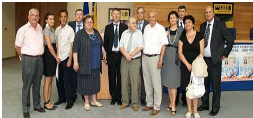
Delegati iz Skandinavije