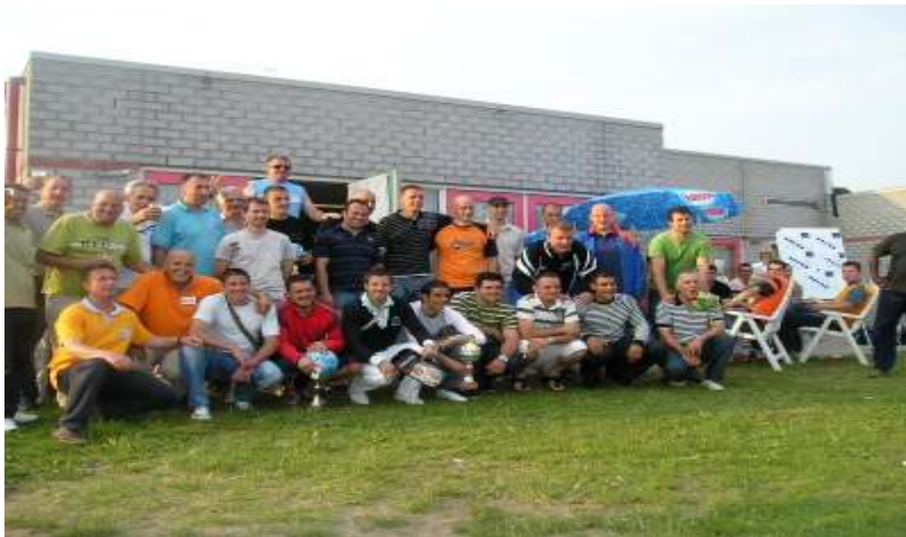
Organizatori, sponzori i ucesnici Turnira Arnhem 2008 zajedno

Nakon izuzetno jake konkurencije, prikazane lijepe igre i uzuzetno korektnog sportskog ponašanja došlo se i do pobjednika turnira.