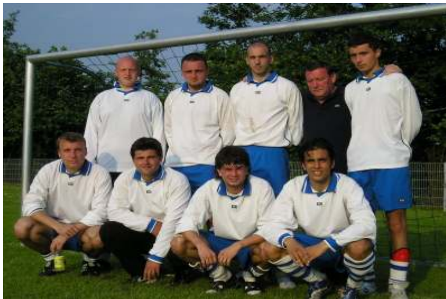
Ekipa Berek: Pobjednik turnira

Prvo mjesto osvojila je ekipa: B E R E K