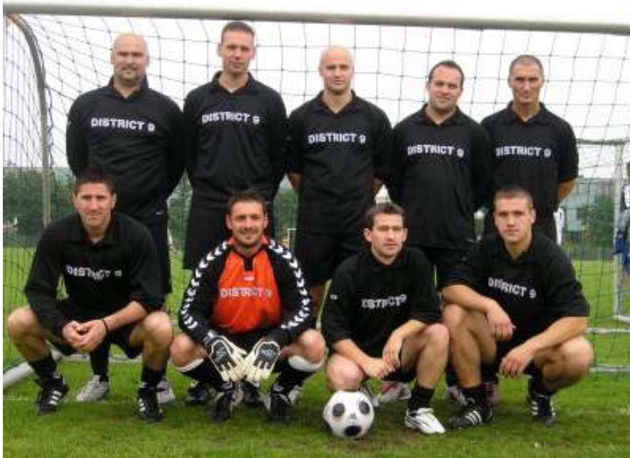
Ekipa Krazy Hadzije iz Roterdama, drugo mjesto

Drugo mjesto osvojila je ekipa Krezy Hadzije iz Roterdama.