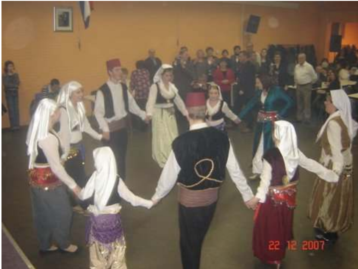
Nastup folklorne sekcije IKC „Bosnjak“ odusevio je sve prisutne

IKC Bosnjak iz Arnhema ( www.Bosnjak.nl ) je po tradiciji i ove godine (22. decembra 2007.) organizovao predivno Bajramsko sijelo. U prethodnom pozivu za ovu proslavu nije izostala ni lijepo dizajnirana cestitka Bosnjacima i Bosnjakinjama za Mubarek Kurban Bajram sa zeljama za sreću, dobro zdravlje, bericet i halal nafaku.